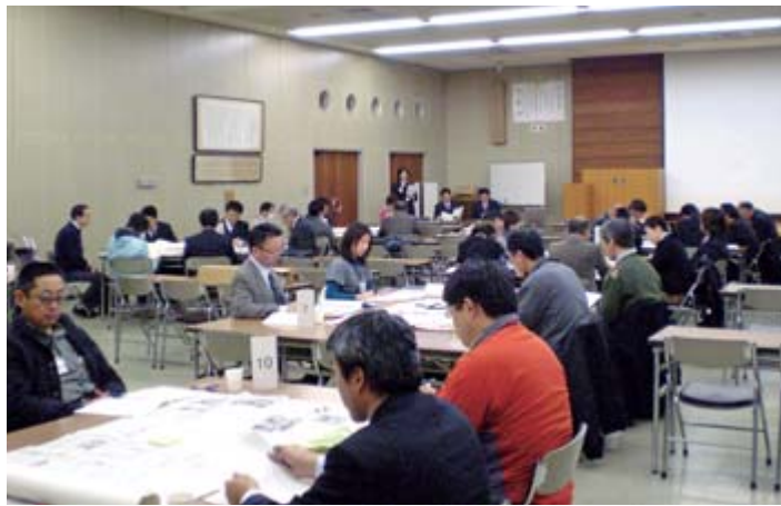
上 1月19日の第2回委員会で、10のグループに分かれ協議した委員 左 1月13日の全体会で住民「視点」から住民「起点」での取り組みにと講話を行った勝部市長