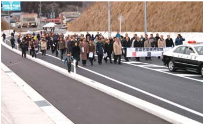
上 新しい市道を関係者や地域住民が歩き初め、待望の路線の開通を祝いました 左 石堂構井田線位置図