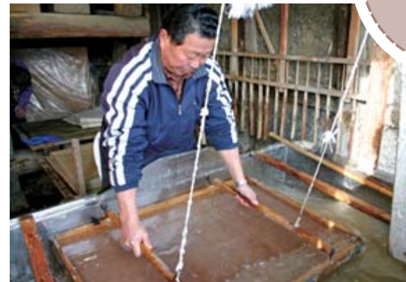
根気が必要な紙すき作業に集中して取り組んだ実習生