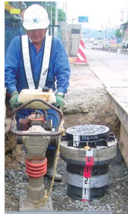
千厩地域で実施している下水道工事