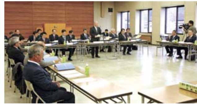
第1回協議会であいさつする勝部市長

勝部市長は「少子高齢化や雇用状況の急激な悪化など地域を取り巻く社会情勢は大きく変化