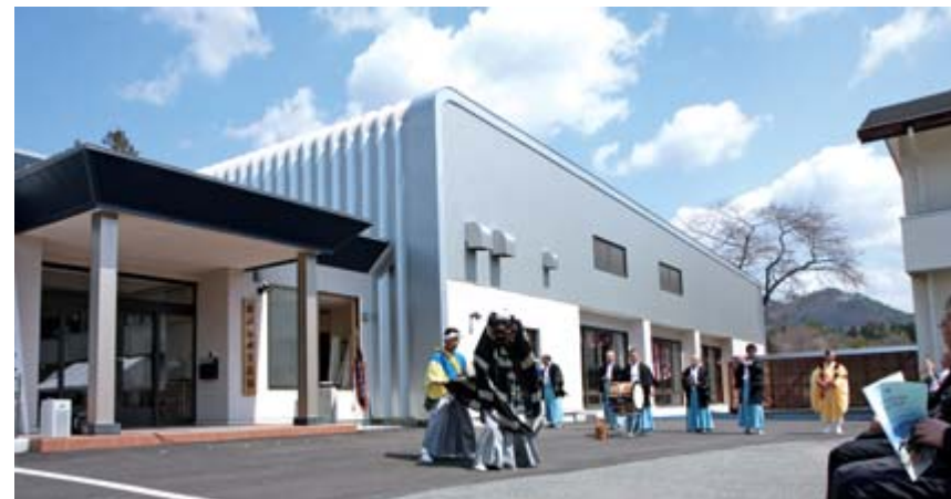
上 落成を記念して演舞する 峠山伏神楽 右 軽運動も可能な交流棟