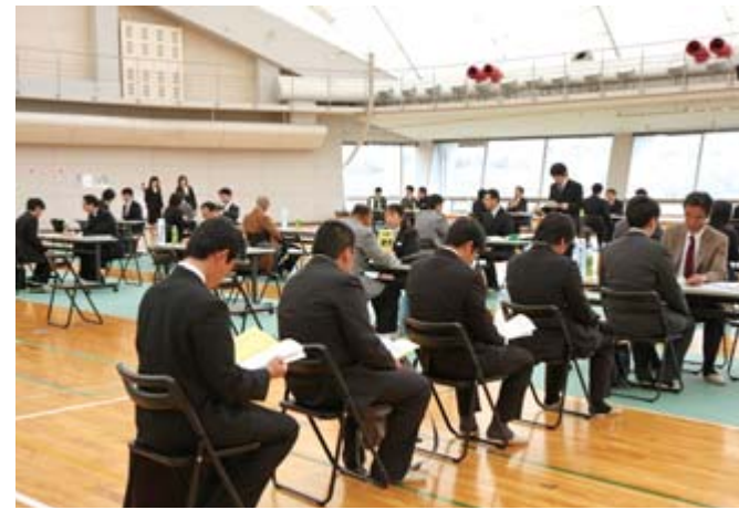
ふる里就職ガイダンスの様子

カード」を手に、興味を持った企業のブースを訪問しながら、人事担当者から説明を受け、熱心に質問していました。