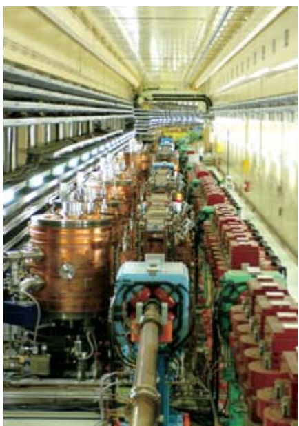
つくば市の高エネルギー加速器研究機構の地下にある加速器