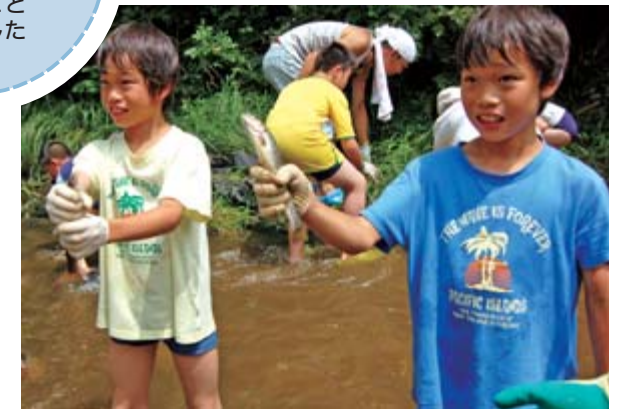
イワナのつかみ取り

ペゴニア原産地としても知られる同国との友好を深めようと開催した同イベント。フリオ・カルデナス駐日ペルー公使も訪れ、来場者約90人と共に本格的な同国の料理を味わいながら、「ロス・ラティーノス」によるフォルクローレ演奏を楽しみました。