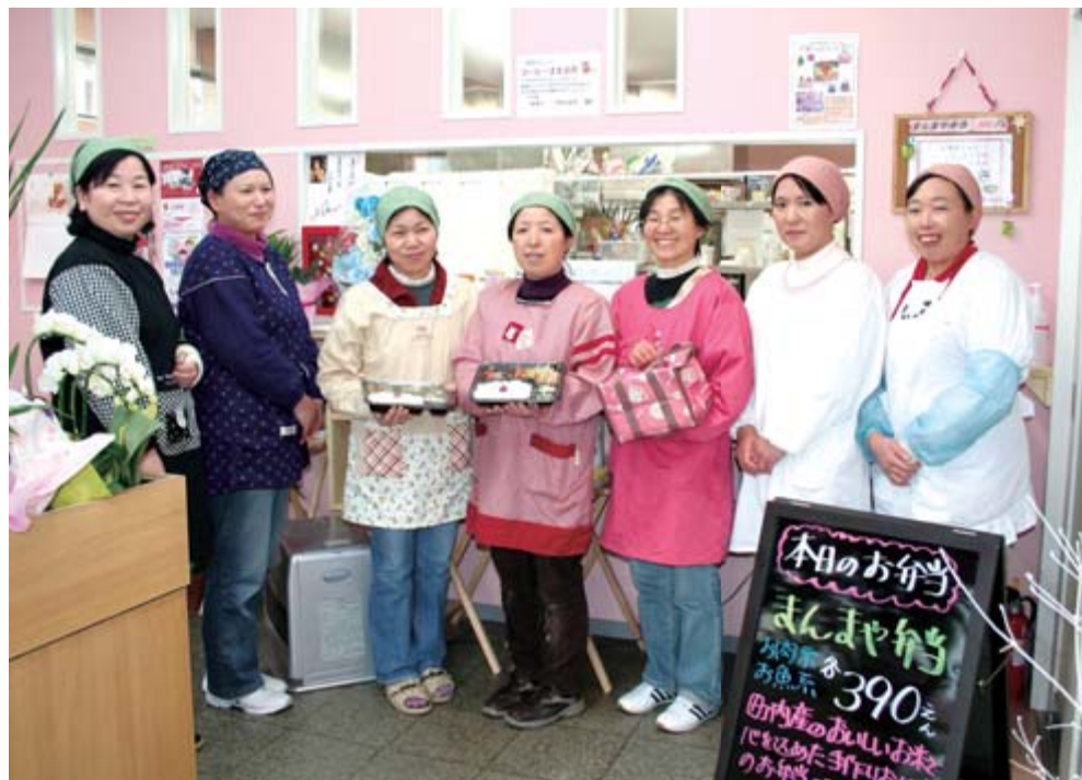
家庭の味を届けたいと弁当の店を開いた「まんまや」の皆さん

立ち上げに絞り込んで講座を重ね、いちのせき元気な地域づくり事業「新規店舗開店等支援事業」を活用。退職から約1年を経て、夢を実現させました。 地元産の米や野菜を中心に、国産の食材を使い『家庭の味』にこだわった弁当は、肉と魚の2種類から選べる日替わり(390円)で、高齢者や単身者にも食べてほしいと塩分や油を控えた飽きのこない味を目指しています。職場や高齢者宅に届ける宅配弁当(400円)は、温かいごはんと手作り味噌汁を味わってもらおうと、保温容器と保温バッグを使っています。