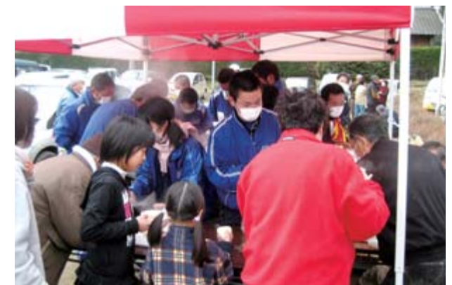
豚汁とおにぎりの炊き出しを行う大東高校の生徒