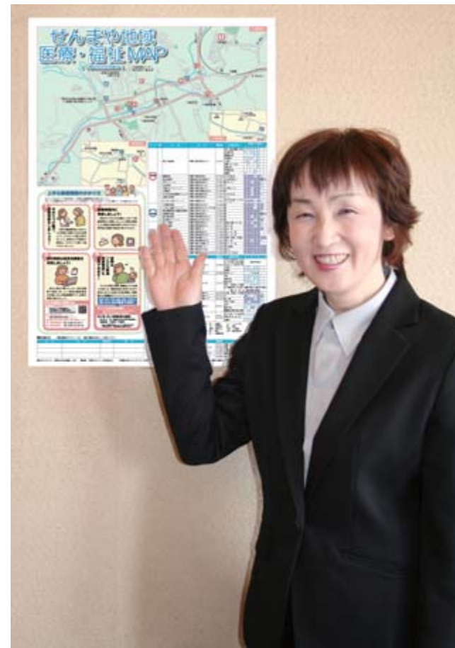
雇用促進住宅に入居する被害を受けた120世帯にも配付を予定

このほか、同町交流促進センターでは、気仙沼市(小泉地区)から避難している人に入浴サービスの提供を行っており、避難所生活で疲れた体を癒やしています。