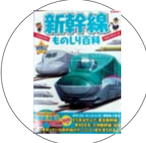
「新幹線ものしり百科 きれり!好奇心」

水谷隆介 著 全国を走っている新幹線をかっこいい写真とDVD映像で紹介。N700系の人気車両から東北新幹線「はやぶさ」を代表とするE5系や新800系の最新車両まで網羅。運転士さんや車掌さんの仕事など、知りたい情報がいっぱいです。