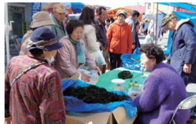
甚大な被害を受けた宮城県女川町から元気に参加された出店者