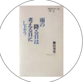
「雨の降る日は考える日にしよう」

清水 妙 著 「思い立ったら、時を移さず」「自分の頭で考える」「ひとりで生きる」…兼好法師が遺してくれた数々の言葉。人生の達人・清水妙の最高の生き方エッセイ。元氣と勇気たっぷりの生き方読本です。