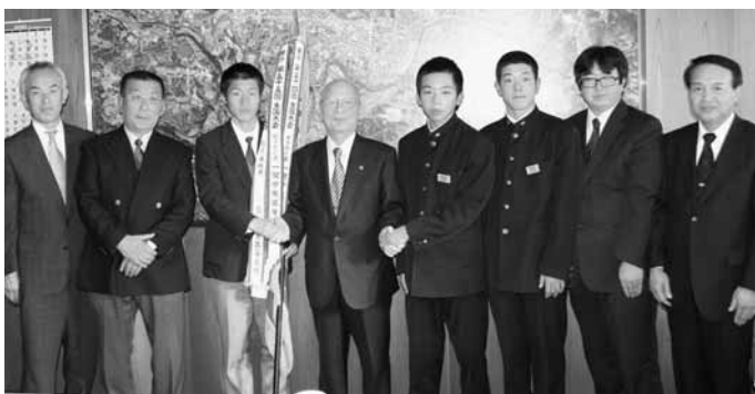
全国大会での健闘を誓った室根中と一関学院高の皆さん

室根中は12月18日に千葉市昭和の森特設コースで、一関学院高は12月25日に京都市西京極総合運動公園陸上競技場を発着点とするコースで、それぞれ全国都道府県の代表を相手に挑みました。