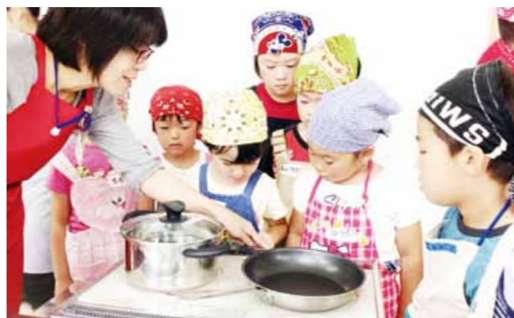
8月に開いた「夏休み学びの土曜塾『IHクッキング教室』」

長坂地区にある東山公民館は、東山町の中心部に位置し、付近には名勝「狛鼻溪」や「幽玄洞」があります。かつては、公民館、勤労青少年ホーム、体育館が併設していましたが、老朽化などにより、2009年9月に新築。芸術文化活動と生涯学習の拠点として、東山公民館・多目的ホール・東山図書館の3つの機能が同居する複合施設になりました。オール電化の施設は、火災の危険性が低く、燃焼ガスや水蒸気の発生がないクリーンな空調を備えています。