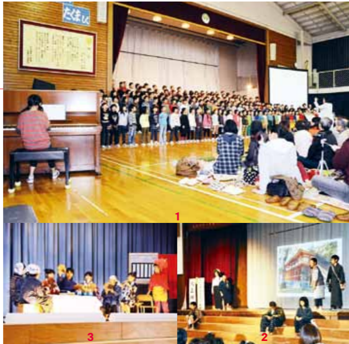
1_全校合唱「おくりもの」182人でつむぐ歌声は観客の心へ響きました（長坂小）／2_140年の歴史を振り返った6年の発表。その時代に合わせた言葉づかひや服装で当時を再現（松川小）／3_2年「泣いた赤おに」のワンシーン。一生懸命の演技に拍手喝采（田河津小）

長坂小の5年生は、朗読劇や年表で、没後80周年の宮澤賢治の歴史や作品を紹介。賢治の言葉「世界全体が幸福でなければ、個人の幸福はありえない」で締めくくりました。