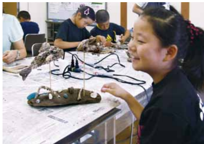
8月に行われた川の楽校「流木で作る水のいきもの」の様子

川崎公民館は、旧川崎村の生涯学習ステーションとして、1998年12月に村長部局の地域づくりセクションと教育委員会部局の社会教育課、公民館、図書館等が一体になって「地域の活性化」「地域間交流のための活動を支援する施設として設置、開館しました。合併後