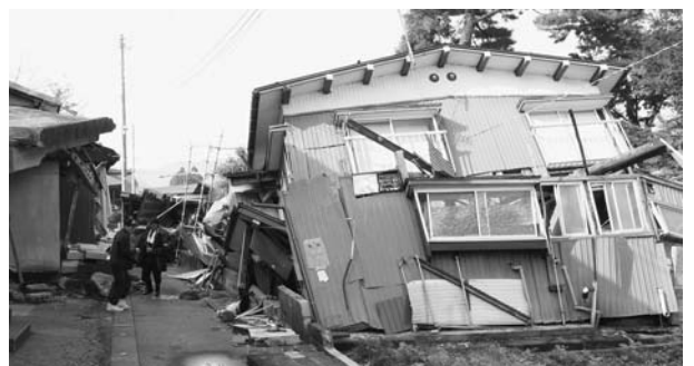
新潟県中越地震で倒壊した住宅