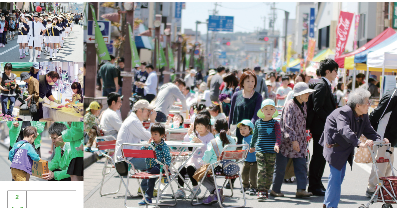
1_大勢の人でにぎわう大町歩行者天国 / 2_一関小のマーチングバンドが堂々とした演奏を披露 / 3_体験コーナーでケーキ作りに挑戦 / 4_色とりどりの花の苗を吟味して買い求める人 / 5_中学生による緑の羽根募金活動も行われた

Stylish & Smiling, Anytime, By Your Side, With Your Life http://www.city.ichinoseki.iwate.jp