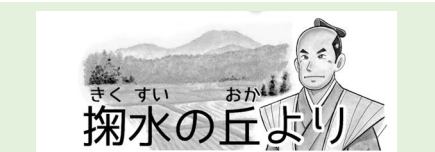
芦東山記念館 ☎ 3861