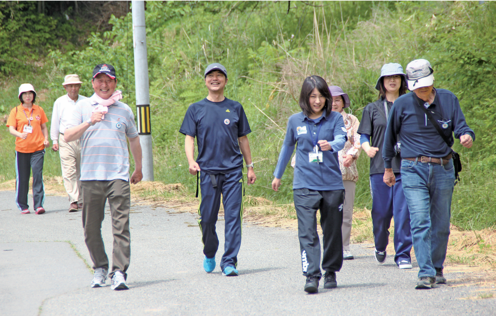
一緒に歩く仲間があると楽しさもアップ。和気あいあいと談笑しながら歩く参加者

編集後記 ツバメ3羽が我が家を調査中。縁起が良いといわれ、人と自然の共存を象徴する大事にしたい野鳥だが、フンで汚れるのが心配で複雑です。(菅原)