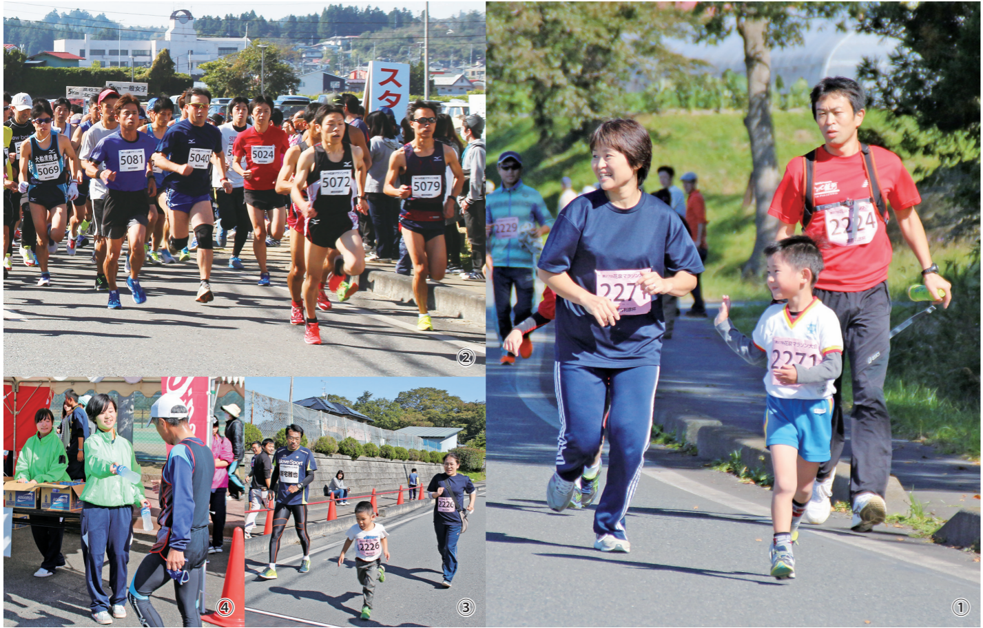
①声援に応えながら楽しそうに走る親子/②勢いよくスタートする一般男子5kmの部/③ゲストラランナーの自宅さんと一緒にゴールする親子/④給水所でボランティアをする花泉高校の生徒