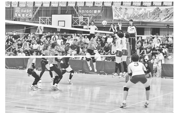
多くの観客の声援の中行われた成年女子バレー

この国体には、地元の高校生をはじめ、多くの市民が運営に関わりました。花泉の出前餅つき隊による餅つきと老松大黒舞保存会、老松小学校児童による大黒舞の披露やおにぎり、いわて南牛の振舞いなど、他県から訪れた選手、応援団等を花泉らしいおもてなしで迎えました。