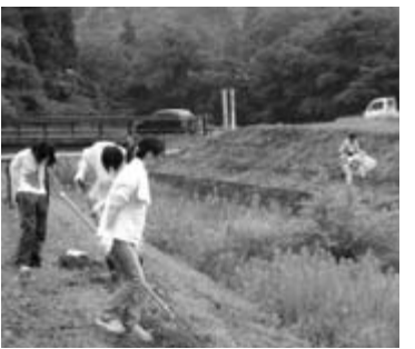
現地調査に先立ち、地元住民を中心に岩手大生、市職員などのボランティアが草刈りを実施

地調査報告などを基に評価レポートをユネスコの世界遺産委員会に提出。同年7月カナダのケベックで行われる世界遺産委員会登録の可否が審議される予定です。