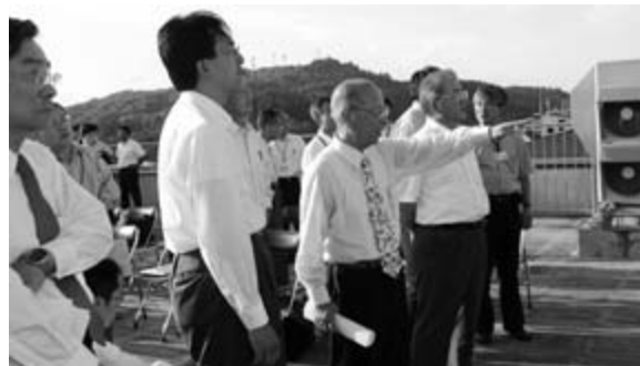
屋上から磐井川を望み、堤防改修などを説明しました