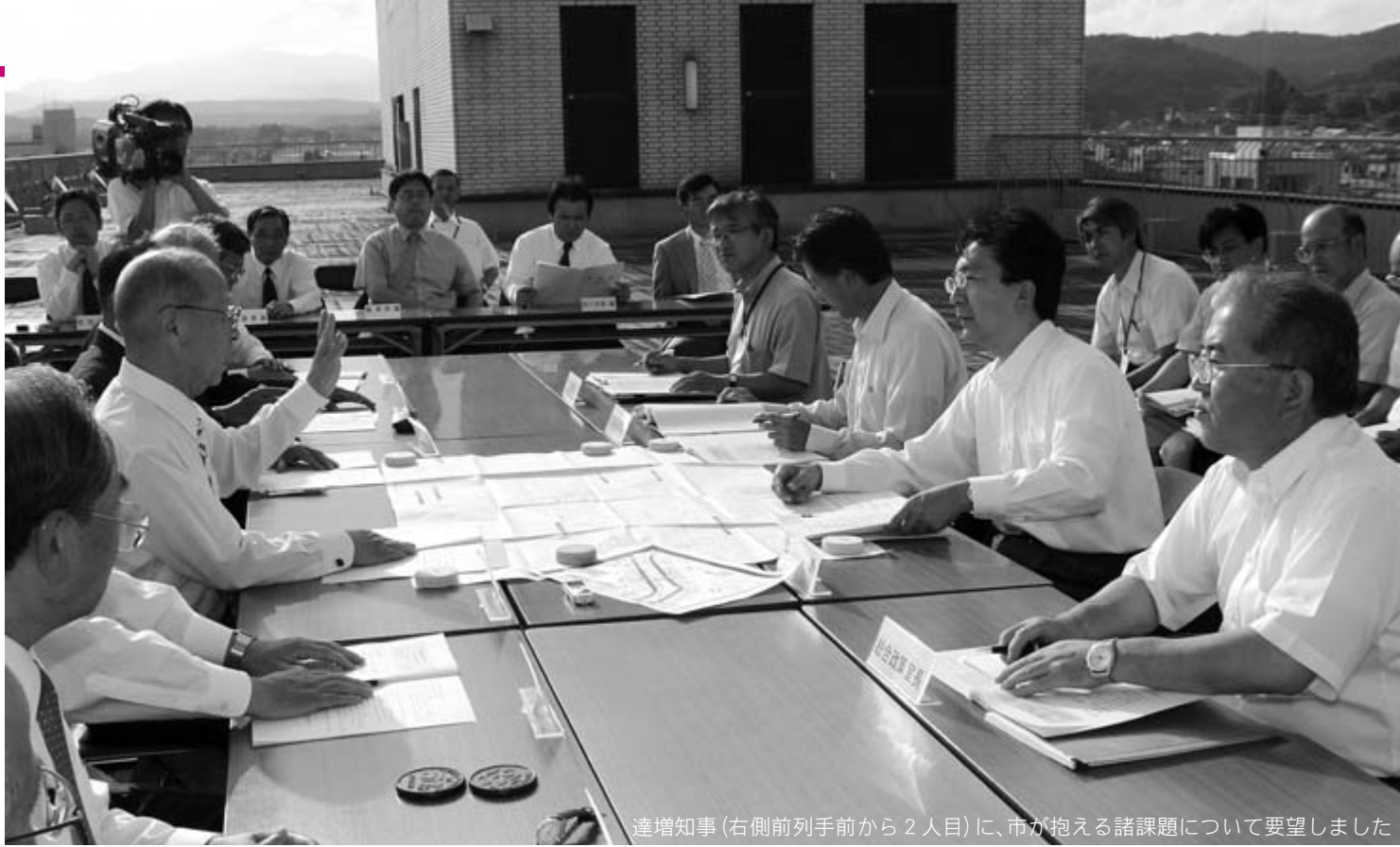
達増知事(右側前列手前から2人目)に、市が抱える諸課題について要望しました

平成19年度県知事への要望は8月21日、市役所本庁で行われました。達増拓也知事ほか県関係者と、浅井市長、佐々木時雄市議会議長ら市、市議会関係者、一関地方選出の県議会議員が出席し、達増知事に浅井市長が45項目からなる要望書を手渡しました。