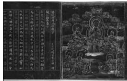
【国宝】 紺紙金銀字交書一切経 維摩詰経巻下 (見返絵及び巻首) 中尊寺大長寿院蔵

中尊寺文書は、中尊寺に伝来する古文書で、中世東北における代表的な寺院文書です。国の重要文化財に指定され、その半数近くが骨寺関係文書です。なかでも有名なのは、天治3(1126)年に書かれた「中尊寺経蔵別当職補任状案」です。藤原清衡が、紺紙金銀字交書一切経を8年かけて完成させた自在房蓮光の功をねぎらい、中尊寺経蔵の初代別当職と骨寺村の管理を任せるといった内容の文書です。補任状案とは任命書の写しという意味です。