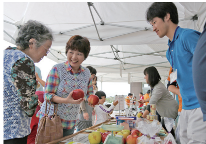
☎本庁農政課 ☎② 8427

りんご、ナシやブルーベリーなど、地元が誇る旬の果物を販売します。「利きりんご」「りんご重さ当てクイズ」など楽しい企画も盛りだくさんです。 ◇日時…9月23日④～24日⑤ 10:00～16:00 ◇場所…コープ一関コルザ