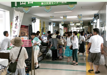
☎本庁農林部政策推進課 ☎内 8480

JR一ノ関駅東口の橋上通路で農産物や伝統工芸品などを販売する「駅マルシェ」。今年3回目の開催です。 ◇日時…9月18日⑤⑥ 10:00～15:00