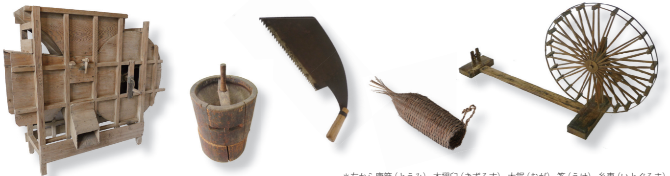
*左から唐箕（とうみ）、木摺臼（きずるす）、大鋸（おが）、釜（うけ）、糸車（いとぐるま）