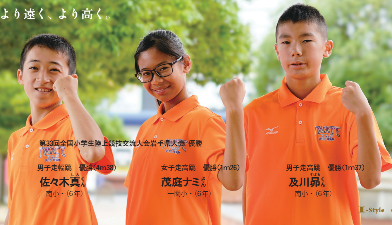
第33回全国小学生陸上競技交流大会岩手県大会 優勝