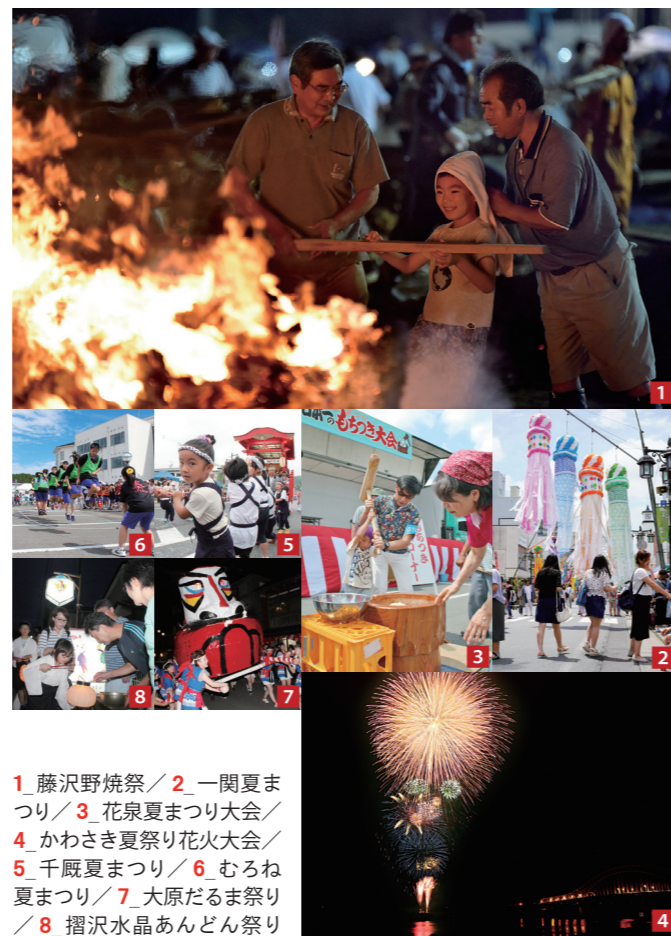
1_藤沢野焼祭 / 2_一関夏まつり / 3_花泉夏まつり大会 / 4_かわさき夏祭り花火大会 / 5_千厩夏まつり / 6_むろね夏まつり / 7_大原だるま祭り / 8_摺沢水晶あんどん祭り

踊り手と手作りの山車が地元商店街を練り歩く。7月29日の「千厩夏まつり」を皮切りに、市内各地で恒例のイベントが開かれ、市民や観光客が地域色豊かな行事を楽しみました。 「むろね夏祭り」は7月30日、室根支所駐車場で行われ、ミニ四駆大会、縄跳び大会などに幅広い年代が参加しました。 「一関夏まつり」は8月4日から6日の3日間、大町などで行われ、磐井川川開き花火大会、二代目時の太鼓大巡行、くるくる踊りパレードなど華やかなイベントが観客を魅了しました。 「花泉夏まつり」は5、6の両日、花泉支所駐車場で開かれ、「日本一のもつき大会」では参加者が餅つきに挑戦しました。 「縄文の炎・藤沢野焼祭2017」は12、13の両日、藤沢町の藤沢運動広場「特設縄文村」で開催。県内外から寄せられた759点の土器を11基の窯で焼き上げました。 「大原だるま祭り」は15日、大東町の大原商店街で行われ、新成人39人が元気な掛け声と共に大だるまを担いで夜の商店街を走り回りました。 「摺沢水晶あんどん祭り」は13日から15日の3日間、大東町の摺沢商店街で開催。13日は盆の迎え火に合わせ、小僧姿の児童26人がちょうちんを手に行進しました。 夏イベントのフィナーレを飾る「かわさき夏祭り花火大会」は16日、川崎町薄衣の北上大橋付近で行われ、2尺玉を含む1万発の花火が夏の夜空に大輪の花を咲かせました。