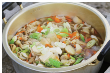
☎磐井河原いものこ会実行委員会(観音) ☎② 8427

一関特産の「曲りねぎ」や「土垂里芋」など、一関の秋の味覚を手ぶらで楽しめます。利用予定日の5日前までに予約が必要です。それ以降の予約は相談してください。 *雨天の場合も食材の受け取りは必要です ◇日時…9月30日④～11月5日⑤の間の④⑤⑥ 10:00～15:00 ◇場所…遊水地記念緑地公園(市総合体育館付近) ◇費用…①いものこ汁材料(6杯程度)・2千円②焼肉材料(6人分程度)・3千円③調理器具一式貸し出しAセット(25杯程度)・2千円④Bセット(50杯程度)・4千円⑤鉄板・500円⑥コンロとボンベの追加・1700円 ◇予約専用電話…☎080・3332・0283 ◇予約期間…9月19日④～10月27日⑤ 10:00～17:00 *④⑤⑥は15:00まで