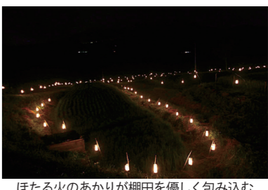
ほたる火のあかりが棚田を優しく包み込む

◇日時：9月20日～11月1日の毎⑩10時～12時(全7回)◇場所：◎東北福祉大学防災士研修室