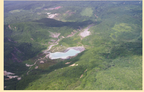
昭和湖を南から望む