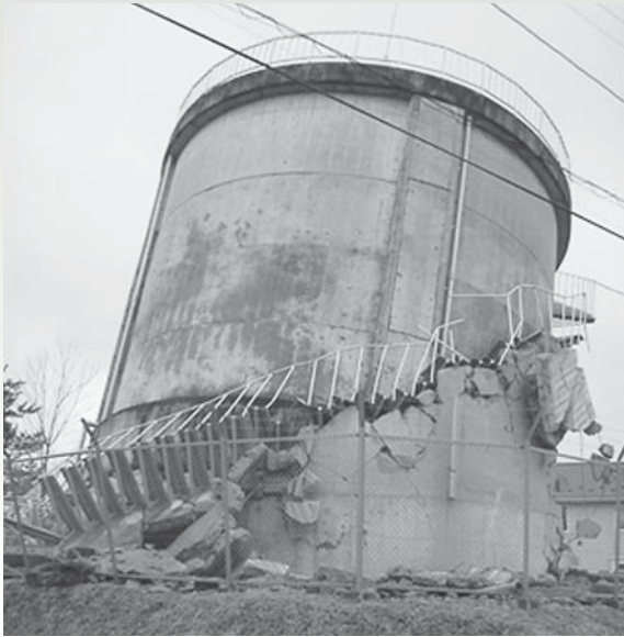
傾壊した沢配水池