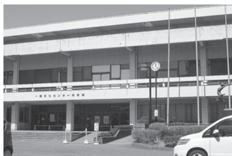
一関文化センター体育館