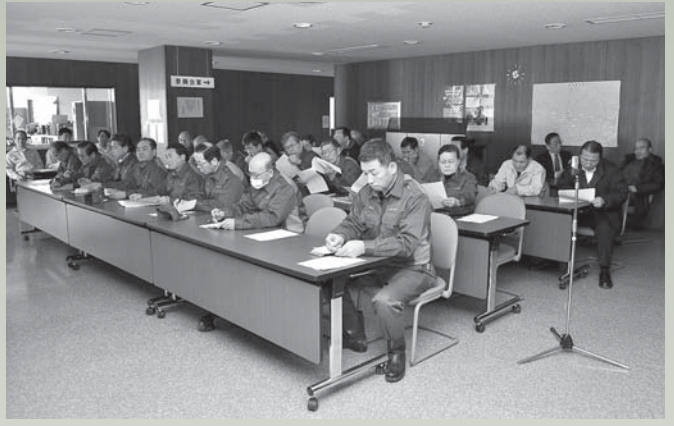
停電のためロビーで開催した議員全員協議会（3月12日）