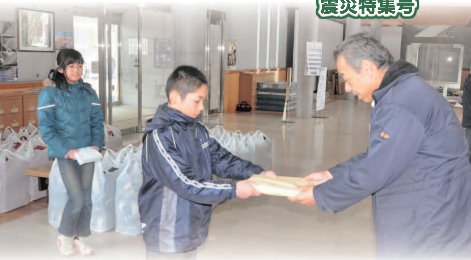
ランドセルを贈呈（気仙沼市）

3月11日に発生した東日本大震災では、市民の4名の方が亡くなり、また、ライフラインが寸断されるなど、市民生活も深刻な影響を受けました。