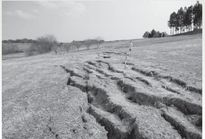
亀裂が生じた牧草地（須川パイロット）