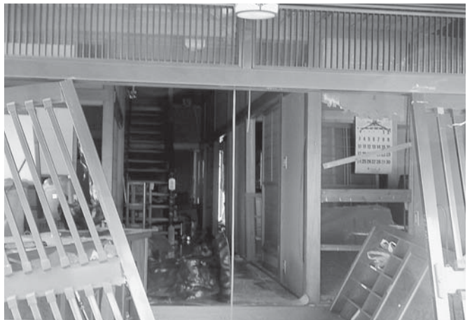
危険と判断された家屋（赤荻地区）