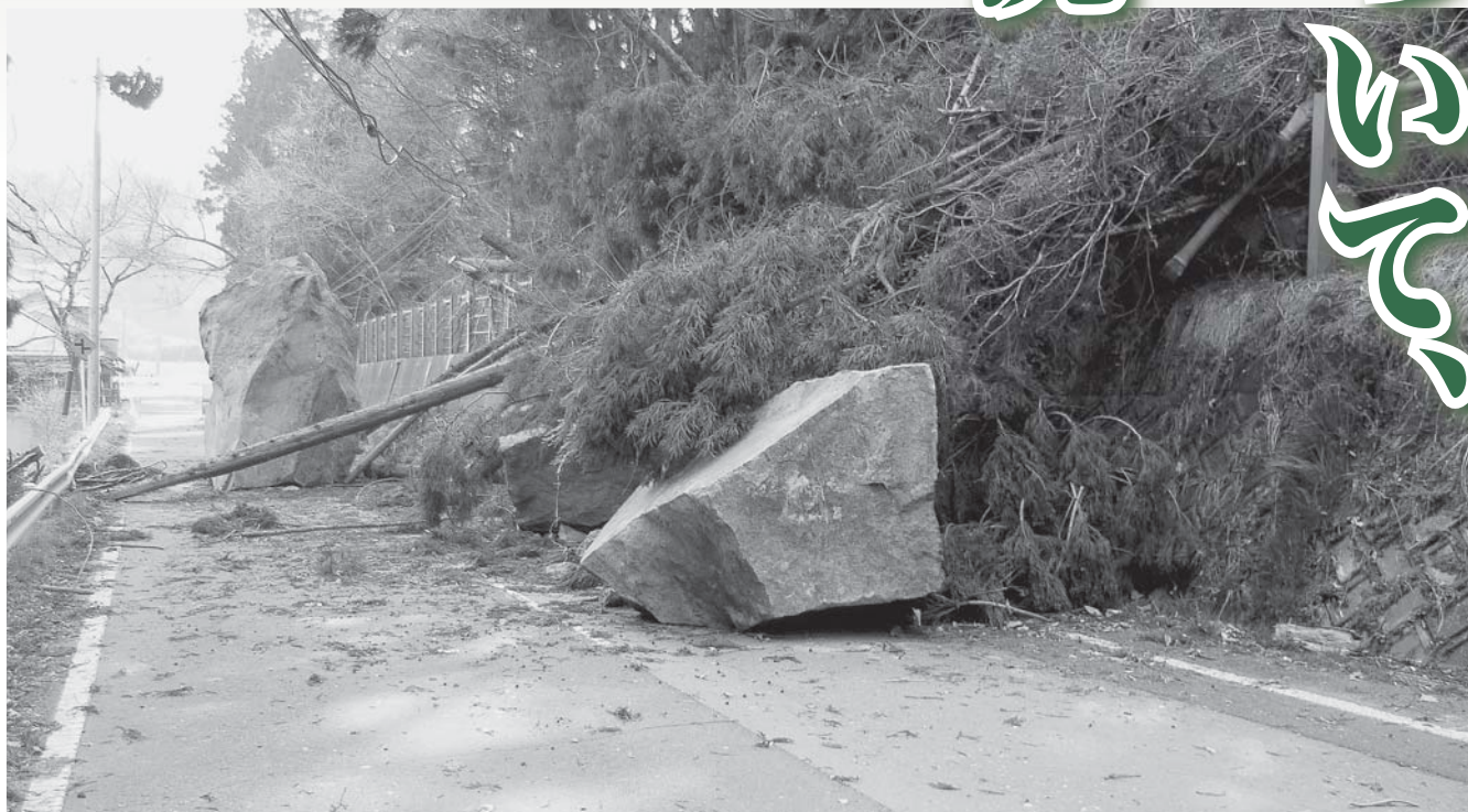
落石で通行止めとなった国道457号（萩荘地区）