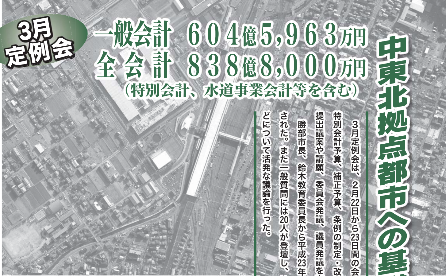
一ノ関駅周辺の航空写真

3月定例会は、2月22日から23日間の会期で、平成23年度一般会計・各特別会計予算、補正予算、条例の制定・改正、財産の無償譲渡など、市長提出議案や請願、委員会発議、議員発議を審議し、議決した。 勝部市長、鈴木教育委員長から平成23年度施政方針、教育行政方針が示された。また一般会計には20人が登壇し、地域医療や協働のまちづくりなどについて活発な議論を行った。