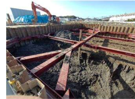
【ホットソイル処理の掘削状況】