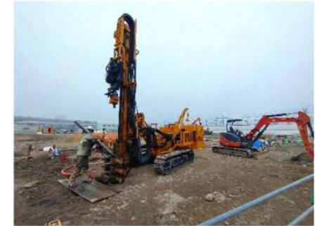
【栄養剤注入用井戸の設置状況】