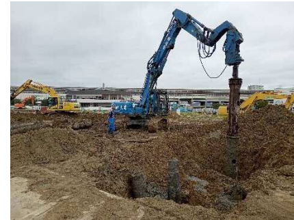
【基礎杭引抜き状況】