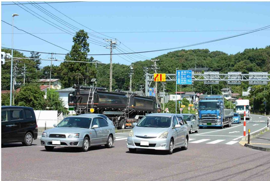
国道4号：大槻交差点以北の4車線拡幅整備