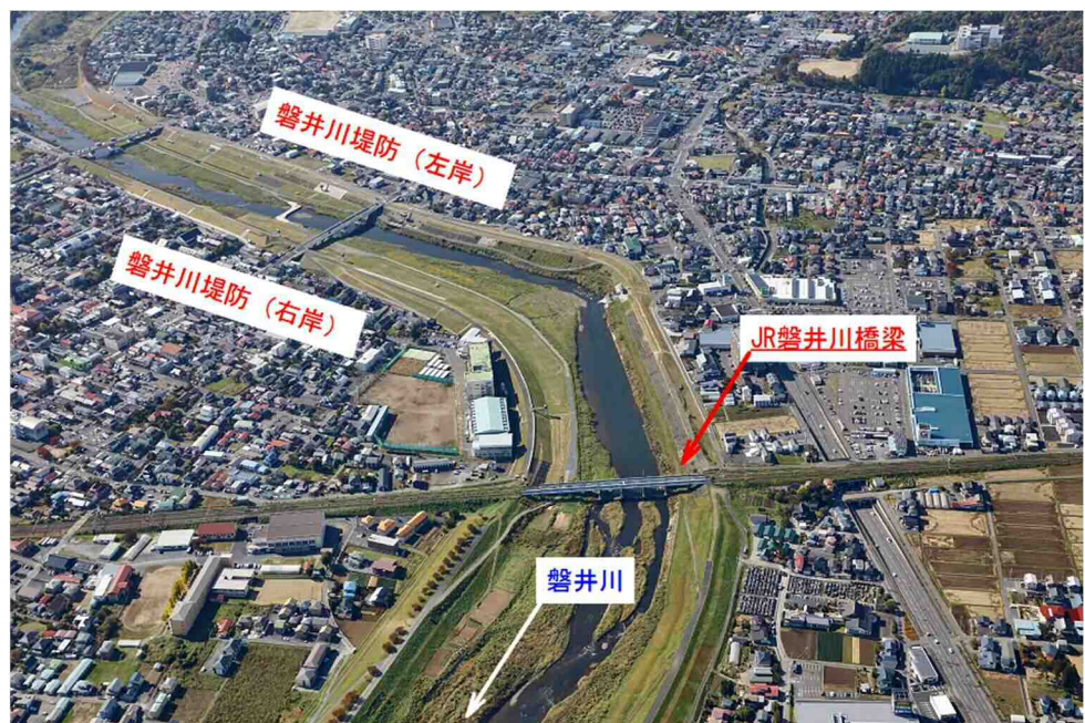
JR磐井川橋梁 (航空写真)

については、一関遊水地と磐井川堤防が一連となった治水安全度を確保するため、JR東北本線磐井川橋梁の早期架け替えを国に対し働きかけるよう要望します。