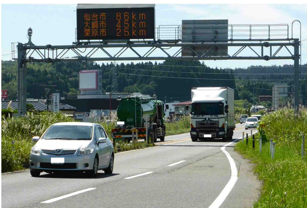
国道4号：高梨交差点以南の4車線拡幅整備