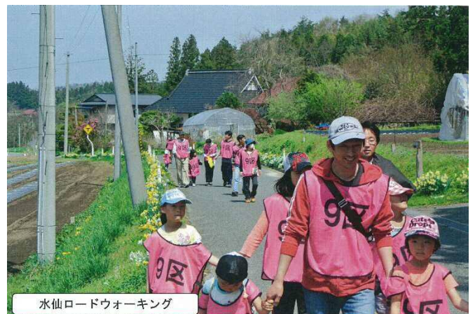
水仙ロードウォーキング