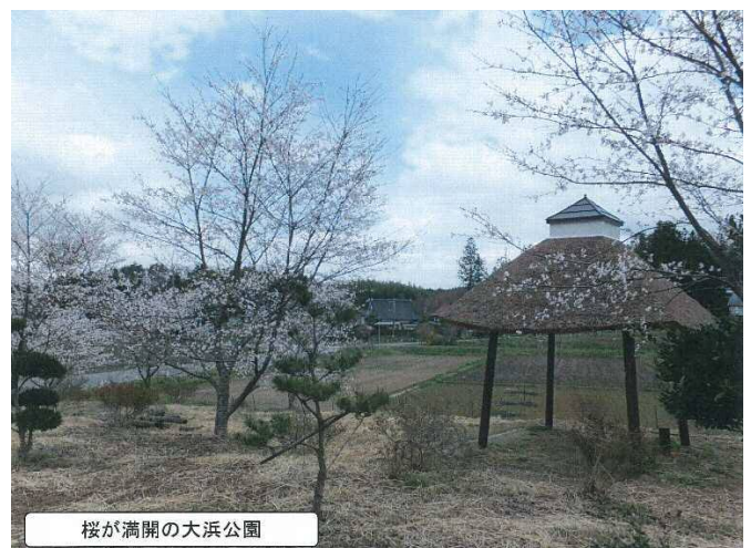
桜が満開の大浜公園

市道大久保八沢線の道路改良事業により、道路整備がされました。それにより、旧道が残地として残りました、その残地と個人所有地の一部を何かに活用できないものかと、集落内の会合などの機会を捉えて幾度となく協議を重ね、約 10 年前から集落の公園にしようとの話が持ち上がり、各家庭にある庭木を持ち寄り植栽したほか、みんなでお金を出し合い桜の苗木を購入して植栽するなど、集落みんなで作りの公園にしようと整備をして